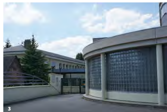
3. Collège Jules-Michelet – VAH

Si le collège Michelet présente une architecture en adéquation avec les immeubles de la reconstruction de Beauvais par ses lignes et ses matériaux (pierres de taille, pavés de verre, ardoises), il est préconisé pour les autres constructions de recourir aux procédés industrialisés. Face à l'urgence des besoins, il faut bâtir vite et à moindre coût. Le béton, le métal, la préfabrication sont ainsi utilisés bien que des reticences soient émises par des conseillers municipaux face à la pérennité de ces matériaux.