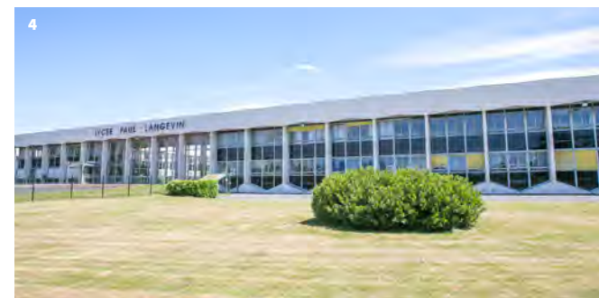
4. Lycée Paul-Langevin – BVS

Le lycée technique, devenu ensuite le lycée Paul-Langevin, a été conçu par le Grand Prix de Rome, Georges Noël, auteur du plan de reconstruction de Beauvais de l'après-guerre. Cependant, l'architecture de cet établissement s'éloigne de ses œuvres des années 1950 et se rapproche du courant moderniste qu'il amorce dans les années 1970 pour le palais de justice de Beauvais qui sera achevé par son fils. Le lycée présente un plan carré et une façade monumentale le long de l'avenue Montaigne, rythmée de piliers sur toute sa longueur. Son hall d'accueil entièrement vitré et traversant ouvre sur une vaste cour intérieure. Une grande partie de l'externat est consacrée aux ateliers, conçus sous forme d'un très vaste hall à la structure novatrice. Ainsi, la couverture vitrée, apportant un éclairage zénithal adapté à l'utilisation des ateliers, est uniquement supportée par des arches en béton précontraint de plus de 50 mètres de long.