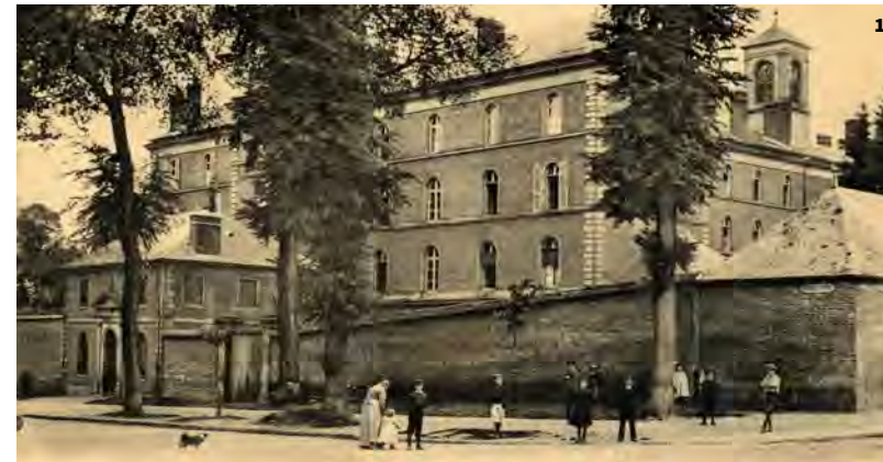
2. Portail d'entrée du lycée Jeanne-Hachette à partir de 1912 – BVS