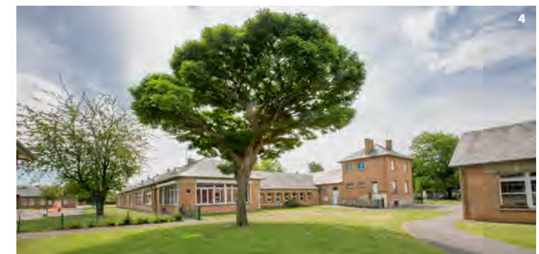
1. École maternelle Paul-Bert - VAH

Ces qualités esthétiques disparaissent à partir des années 1970 en vue de constructions plus rapides et économiques.