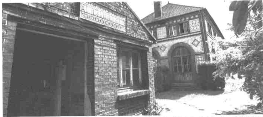
La maison Colozier, rue Saint-Just-des-Marais est visible depuis la rue le long de la voie ferrée. Le site de l'ancienne usine n'est pas ouvert au public. Rens. auprès du GRECB au 03 44 15 55 96.

Située le long d'un axe de circulation important, la façade avait une vocation publicitaire et présentait l'ensemble des produits fabriqués par la manufacture.