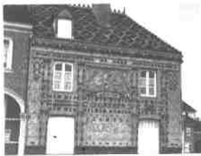
La maison Gréber au 63 rue de Calais est une véritable institution beauvaisienne.

Beauvais ne manque pas d'édifices présentant un véritable intérêt, parmi eux la maison Gréber célèbre pour ses céramiques architecturales et la maison Colozier.