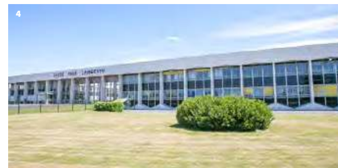
4. Lycée Paul-Langevin – BVS