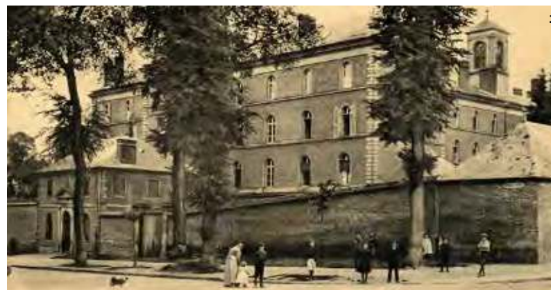
2. Portail d'entrée du lycée Jeanne-Hachette à partir de 1912 – BVS