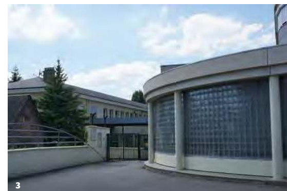
3. Collège Jules-Michelet – VAH

Si le collège Michelet présente une architecture en adéquation avec les immeubles de la reconstruction de Beauvais par ses lignes et ses matériaux (pierres de taille, pavés de verre, ardoises), il est préconisé pour les autres constructions de recourir aux procédés industrialisés. Face à l'urgence des besoins, il faut bâtir vite et à moindre coût. Le béton, le métal, la préfabrication sont ainsi utilisés bien que des réticences soient émises par des conseillers municipaux face à la pérennité de ces matériaux.